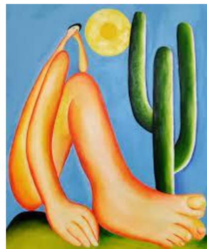
TARSILA DO AMARAL 1886 | 1973